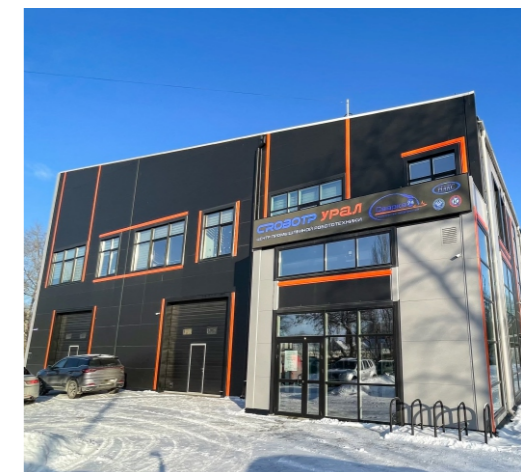
Здание инженерно-технологического центра Содружества Предприятий «Сварка-74»