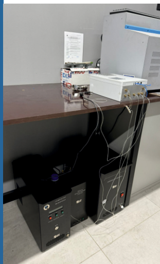
Газовый хроматограф ПИА

Определение состава аргона газообразного