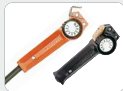
Пульты R10 и R11-T

Два варианта дистанционного управления делают сварку более удобной и экономически эффективной. Пульт R10 позволяет устанавливать параметры сварки на сварочной площадке. Беспроводной пульт R11-T предлагает еще большую свободу и мобильность.