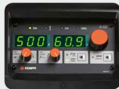
Удобный пользовательский интерфейс