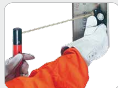
Беспроводные пульты дистанционного управления R11-T можно использовать просто путем касания электрода