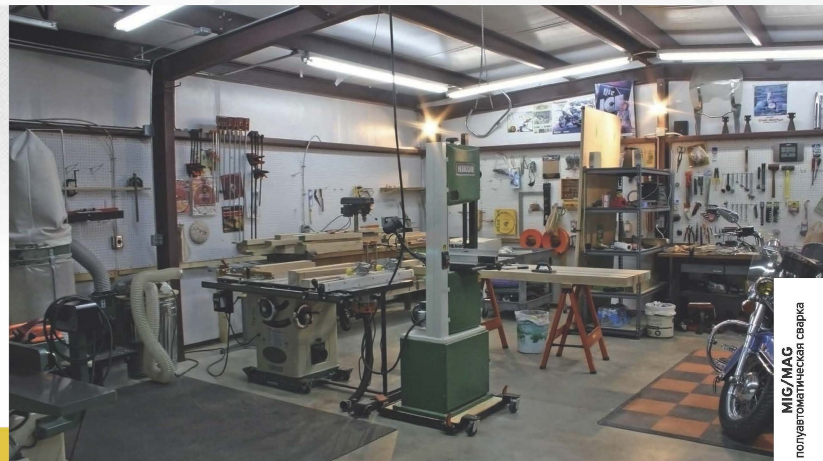
MIG/MAG полуавтоматическая сварка

КЕДР AlphaMIG-200S – умное и многофункциональное устройство в компактном корпусе и современном дизайне, созданное для тех, кто ценит свободу – будь то свобода выбора сварочного процесса или свобода передвижения.